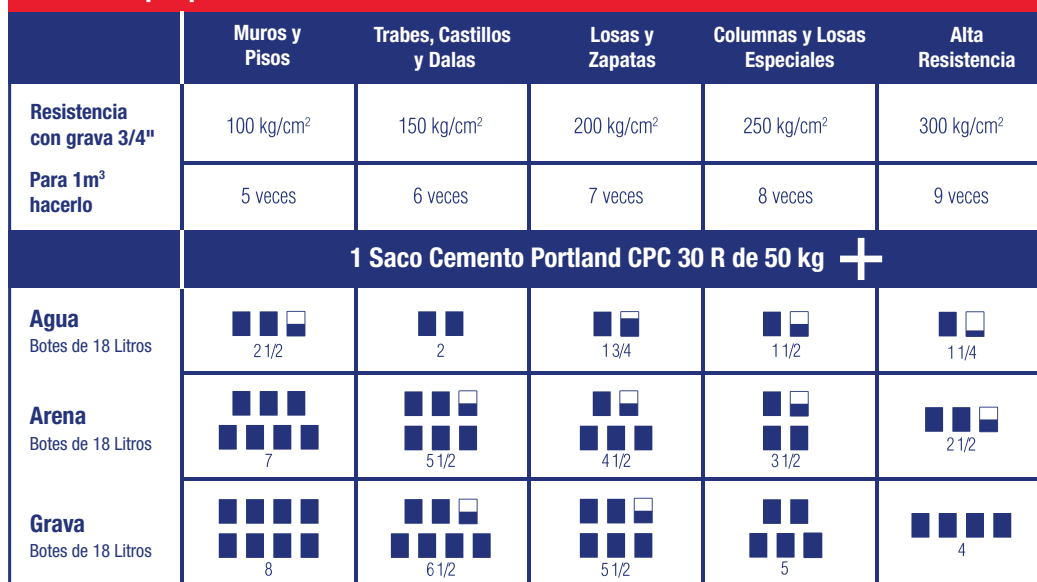
Tabla de proporciones:

Las proporciones de arena y grava sugeridas pueden variar de acuerdo a la calidad de los materiales que estés utilizando.